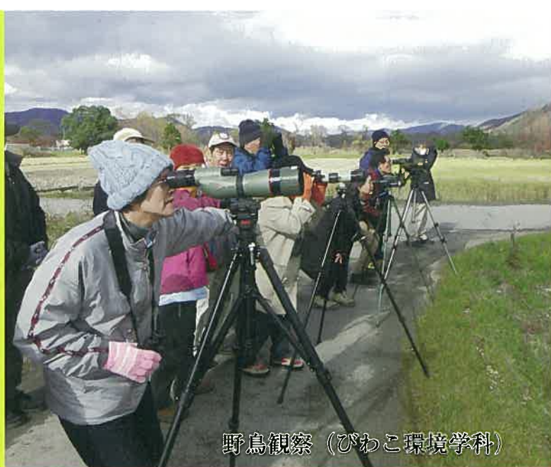
野鳥観察 (びわこ環境学科)