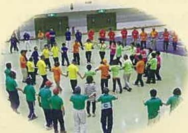
ニュースポーツ大会