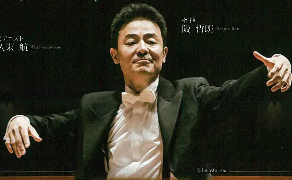
指揮 阪 哲朗 Tetsuro Ban