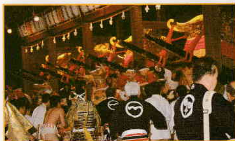
宵宮落し神事 13日 四基の神輿を激しく揺すり、西本宮へと担ぐ。