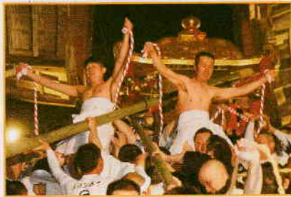
二基の神輿が八王子山を出発 ふもとの東本宮へ鎮まる。