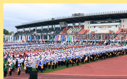
総合開会式の様子

2025年の総合開会式は岐阜市の長良川競技場で行われ、全国から集まった約1万3千人の参加者が競技場に整列しました。高校生による選手に向けた応援や、郡上踊りなどのアトラクションが催され、大会を大いに盛り上げました。