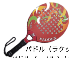
パドル (ラケット) パドル (paddle) とは船の櫂のことで、形が似ていることから名づけられました

ビワコカップパドルテニス大会が2026年2月22日(日)に野洲市総合体育館で開催されます。体験会もありますので、ぜひみなさんも体験してみてください。