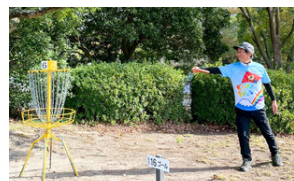
ゴールに向かって投球