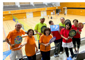
Oneチーム・滋賀のメンバー