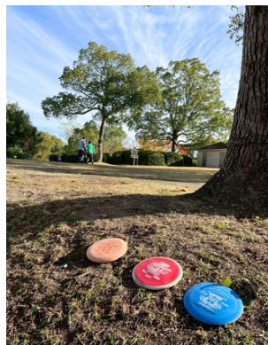
青空に映えるカラフルなディスク

「滋賀県では約40人がディスクゴルフを楽しんでいます。野洲市の希望が丘文化公園に専用のコースがあり練習を行います。協会では定期的に大会を開催しています。多くの方にディスクゴルフの面白さを実感してもらえよう普及に努めています。次回のねんりんピックを見据え、選手も育てていきたいです。皆さま、青空の下、一緒にプレーしてみませんか。」