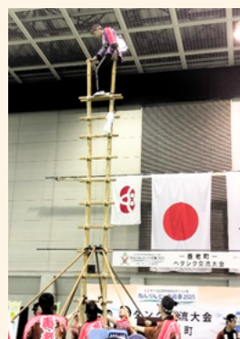
勇壮な姿は圧巻!! 養老鳶はしご登り保存会 による歓迎アトラクション

初日の開会式では開催地養老町の伝統「鳶はしご登り」が披露され、試合会場では地域の方々による「ふるまいコーナー」があったりと、地元の魅力を知ることができました。これもねんりんピックの楽しみのひとつだと思います。ボッチャやカーリングの元となったとも言われるフランス生まれのペタンク。ワールドマスターズや世界選手権も開催されています。是非参加してみませんか。