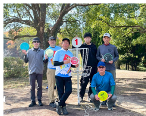
練習メンバーとともに